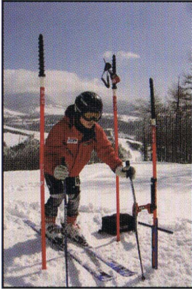
IE-01 を30~50cm前方につけるパターン