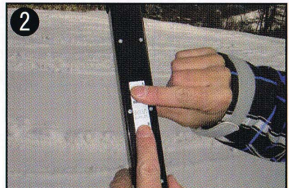
次にAボタンをしっかり押しながらBボタンを1回押すとオンに!

next, press button B once while holding button A down. This will turn the device ON