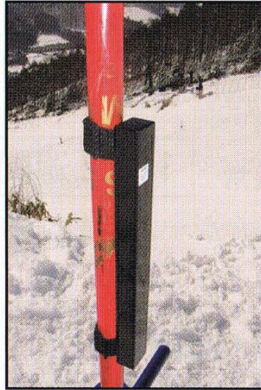
ポールなどでしっかり固定する