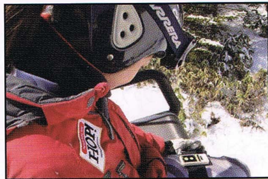
見づらい場合はゴーグルなどを取りましょう!

9 remove your goggles when it is difficult to read.