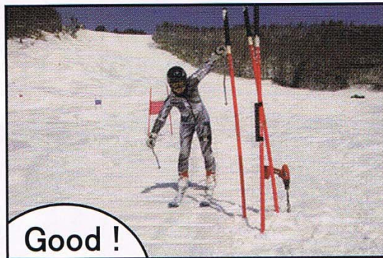
近くを通過し、左手を上げながらゴールが理想

It is ideal to put up your left hand while passing close by.