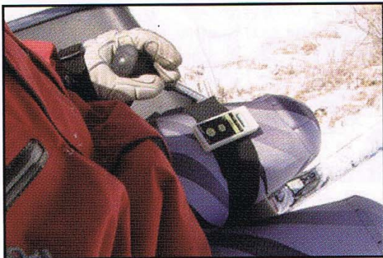
ゴール後リフトでゆっくり見ましょう!